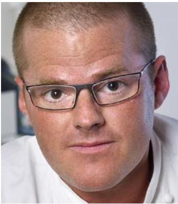
Heston Blumenthal The Fat Duck (London) 3 Sterne Guide Micheline

Wien – Hamburg – Oslo – Toronto – Moskau – San Francisco – New York Tokio – Paris – London – Stockholm – Shanghai – Hong Kong – Sidney