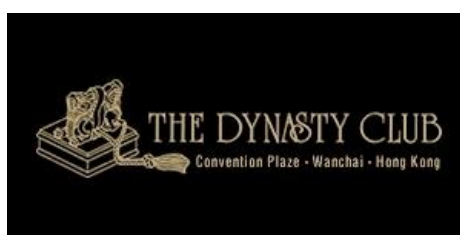
Dynasty Club, Hong Kong